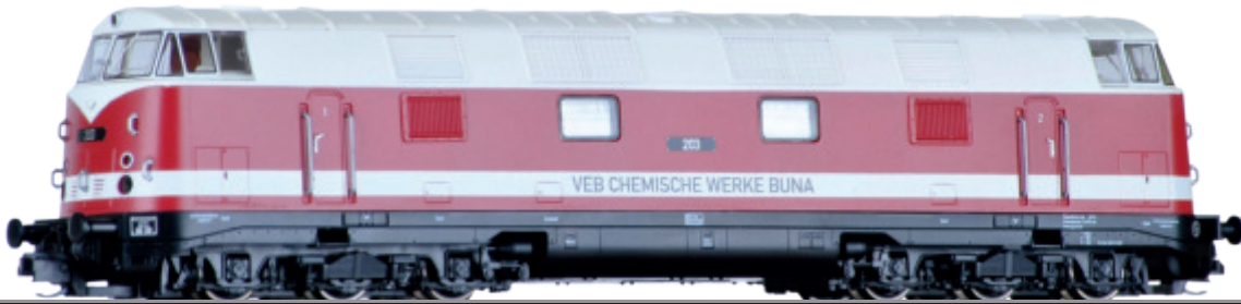
Abbildung zeigt 02697

Art.-Nr. 01209 • 02693 • 02694 • 02695 • 02697